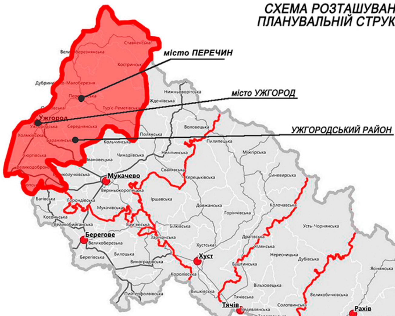
СХЕМА РОЗТАШУВАННЯ РАЙОНУ У ПЛАНУВАЛЬНІЙ СТРУКТУРІ ОБЛАСТІ